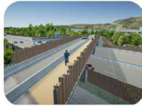
Amélioration des franchissements modes doux