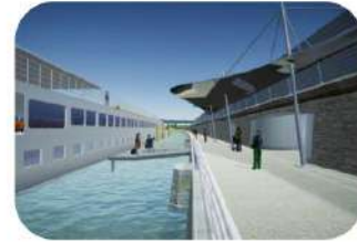
Requalification de la halte fluviale

Le projet, de 32 millions d'euros, sera cofinancé par Vinci Autoroutes, concessionnaire de l'État et les collectivités locales (près de 5 M€ de la Région, 4 M€ du Département, 600 000 € de l'Agglo). Le début des travaux est programmé pour la fin de l'année 2025. Ils concernent les 6 km d'autoroute, qui longent Valence et Bourg-lès-Valence.