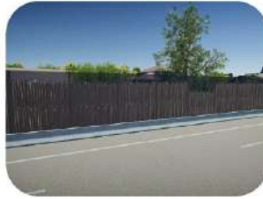
Mise en place ou requalification des écrans acoustiques