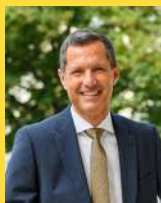
Nicolas Daragon Président de Valence Romans Agglo, Maire de Valence