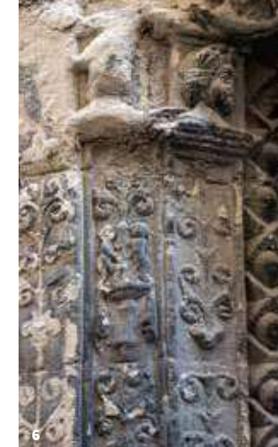
6. Détail de décor Renaissance, rue des Clercs Detail of Renaissance decor, Rue des Clercs