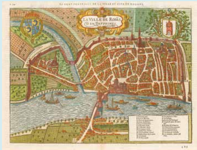
Le vray portraict de la ville et cité de Romans, extrait de la version française de « La cosmographie universelle », F. de Belleforest, 1575 True portrait of the town and city of Romans, extract from the French version of "Universal Cosmographia", F de Belleforest, 1575

Le centre historique conserve un patrimoine du Moyen Âge et de la Renaissance original et diversifié. On peut y lire l'organisation sociale de la ville à cette époque. Au sud et au nord, le clocher de la collégiale Saint-Barnard et de la tour Jacquemart symbolisent les conflits qui opposèrent longtemps le pouvoir religieux des chanoines, et le pouvoir laïc des consuls de la ville, établi en 1366. À côté de l'Hôtel de Clérieu, maison forte d'origine ancienne, les bourgeois enrichis par le commerce du drap de laine se font construire d'imposants hôtels particuliers. La plupart sont aujourd'hui des copropriétés privées et ne sont accessibles qu'à l'occasion de visites guidées. Enfin, les rues anciennes révèlent des détails architecturaux qui témoignent de l'essor de la cité du Moyen Âge au XVIII e siècle.