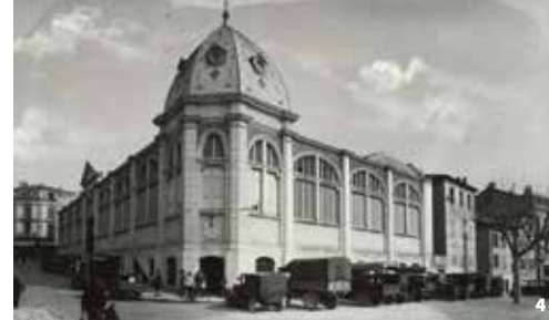
4. Les anciennes halles se trouvaient à l'entrée de la rue Saint-Nicolas (vue depuis les quais de l'Isère)