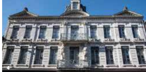
4. 5. 6. Maison des statues et détails Maison des statues and details