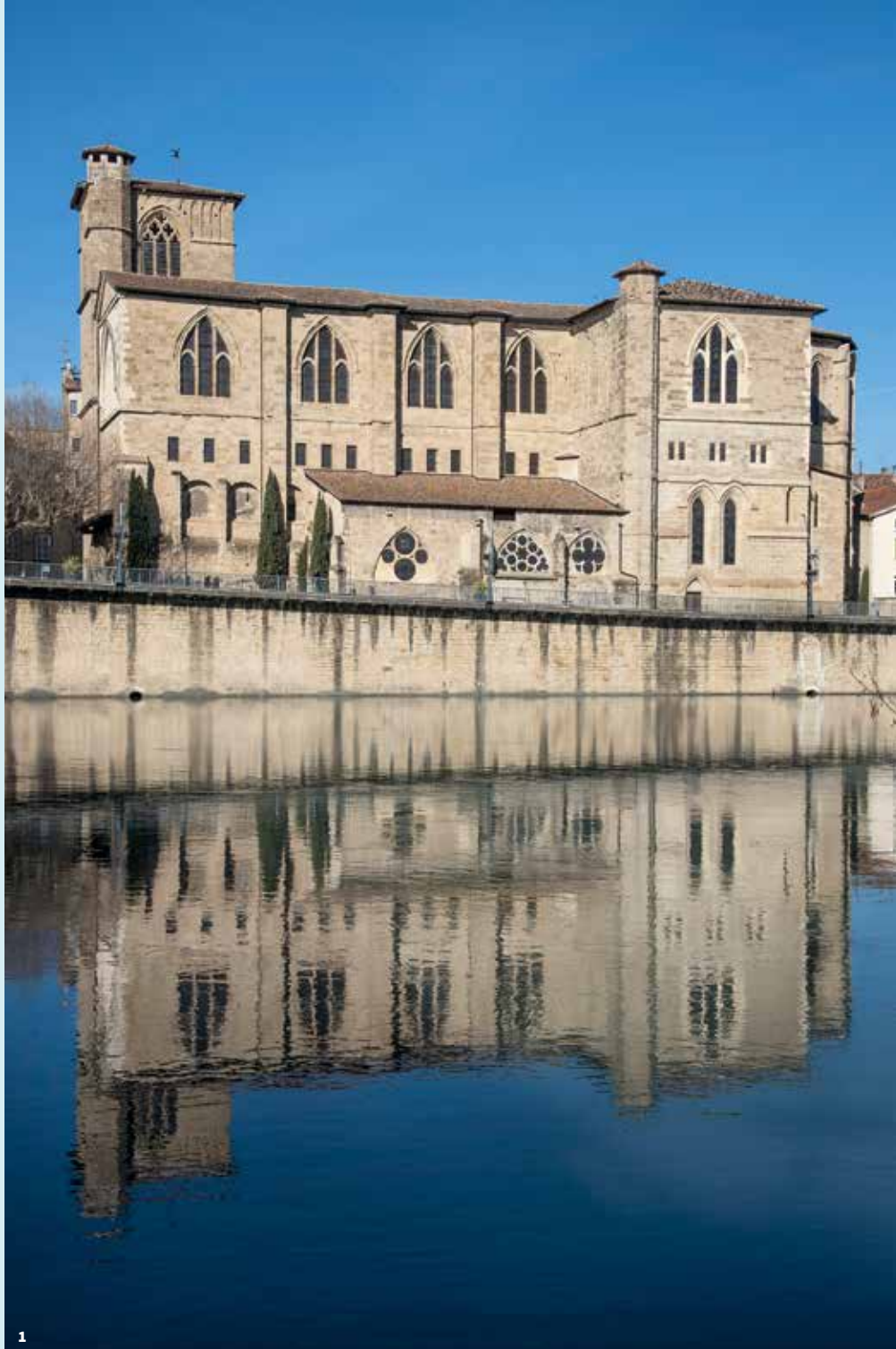
1. Collégiale Saint-Barnard Saint-Barnard Collegiate Church