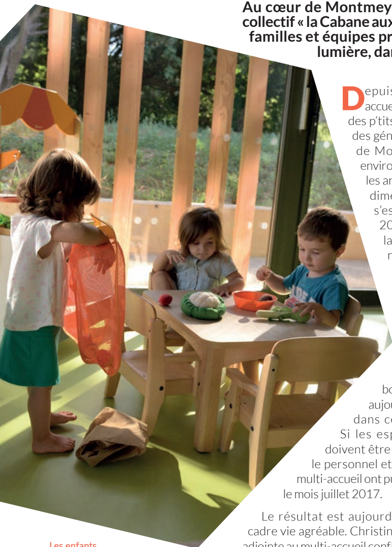
Les enfants dans les nouveaux espaces de jeux. En page de couverture : la vue extérieure du bâtiment

Au cœur de Montmeyran, l'Agglo a ouvert cet été, le nouveau multi-accueil collectif « la Cabane aux p'tits loups », après dix-sept mois de travaux. Les enfants, familles et équipes profitent d'un nouvel équipement fonctionnel, baigné de lumière, dans le cadre agréable du parc de la salle des fêtes.