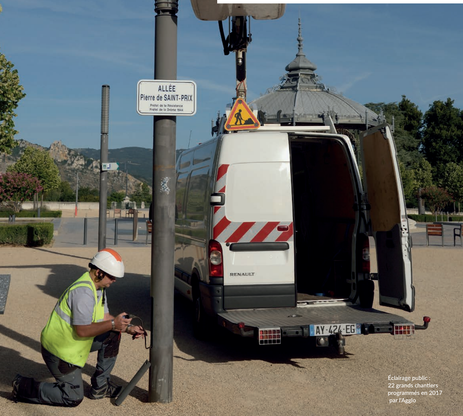
Éclairage public : 22 grands chantiers programmés en 2017 par l'Agglo

Le 25 juin 2015, la Communauté d'agglomération adoptait son projet de territoire 2015-2020 ; un acte fondateur avec des objectifs partagés et une volonté forte de construire un territoire équilibré. Un budget de 304 millions d'euros sera investi d'ici à 2020 pour l'économie, la cohésion sociale, la culture, le cadre de vie et la solidarité territoriale. Aujourd'hui, à mi-mandat et dans un contexte national changeant, un point d'étape s'impose sur les grands chantiers engagés par l'Agglo.