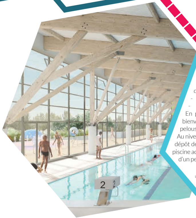
Illustration ci-contre : le projet retenu en août 2017 est celui du groupement : cabinet Xanadu architectures et urbanistes, agence Jomain Rey Huet et bureau d'étude Quadriplus groupe.