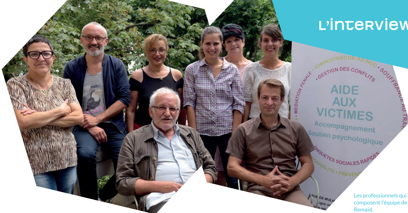
Les professionnels qui composent l'équipe de Remaid.