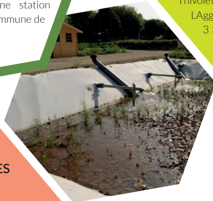
Illustration ci-contre : la STEP d'Eymoux

La création d'un réseau d'assainissement et d'une station d'épuration est également en cours d'étude sur la commune de Miribel.