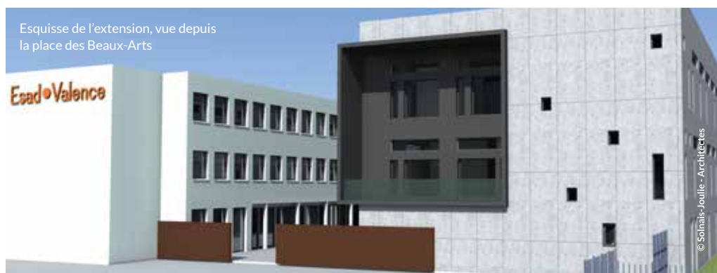
Esquisse de l'extension, vue depuis la place des Beaux-Arts

+ d'infos sur l'ESAD : journée portes-ouvertes le 11 février 2017.