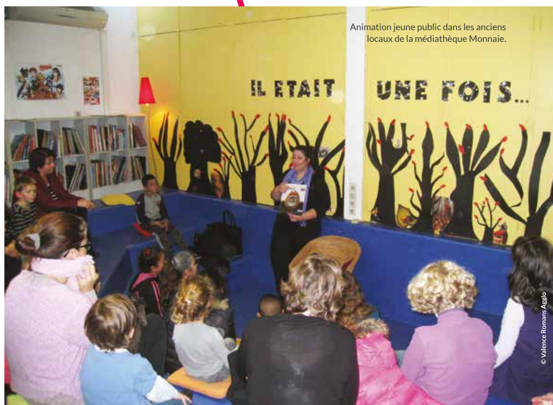
Animation jeune public dans les anciens locaux de la médiathèque Monnaie.

Le projet de réhabilitation de la médiathèque Monnaie située à Romans-sur-Isère a démarré en décembre dernier. Objectifs : accroître les espaces de convivialité pour favoriser les échanges et la détente, réaménager les collections afin de les valoriser, accentuer l'offre des ressources numériques ou encore renouveler le mobilier vétuste pour un meilleur accueil. Dans cette optique, cette rénovation prévoit un réagencement des espaces, une mise aux normes de l'accessibilité et répond à un besoin urgent en matière d'amélioration énergétique, avec le remplacement des menuiseries et l'isolation des toitures terrasses. Par ailleurs, ce nouvel espace permettra à l'équipe de développer ses actions d'animations et d'accueils de classes tout en réaffirmant ses valeurs : vivre ensemble, tolérance, partage, apprentissage de la citoyenneté... Réouverture de la médiathèque prévue pour le printemps 2017. Coût global de l'opération : 513 000€.