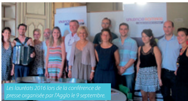
Les lauréats 2016 lors de la conférence de presse organisée par l'Agglo le 9 septembre.

Découvrez le détail de la programmation sur le site de l'Agglo.