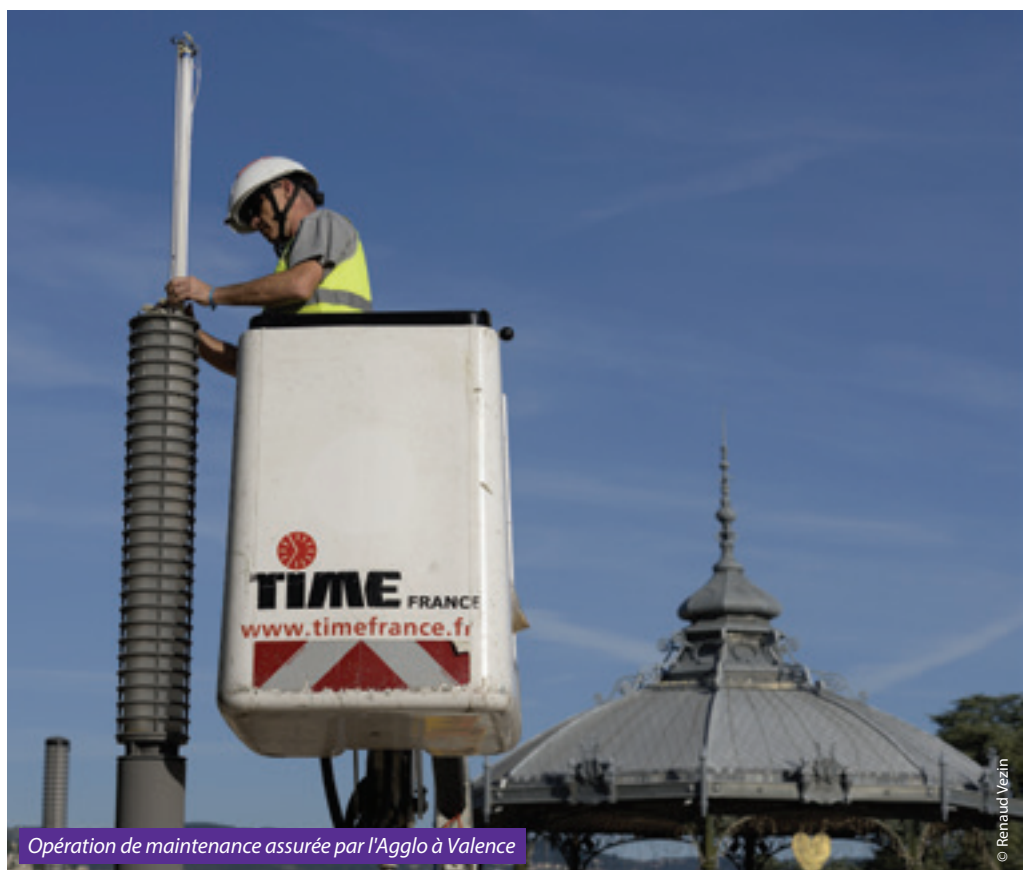
Opération de maintenance assurée par l'Agglo à Valence

Côté organisation, le service éclairage public est organisé en deux unités : une au nord du territoire basée sur Romans et l'autre sur Valence pour la partie sud. Huit agents réalisent la maintenance en régie sur la Ville de Valence. Pour les autres