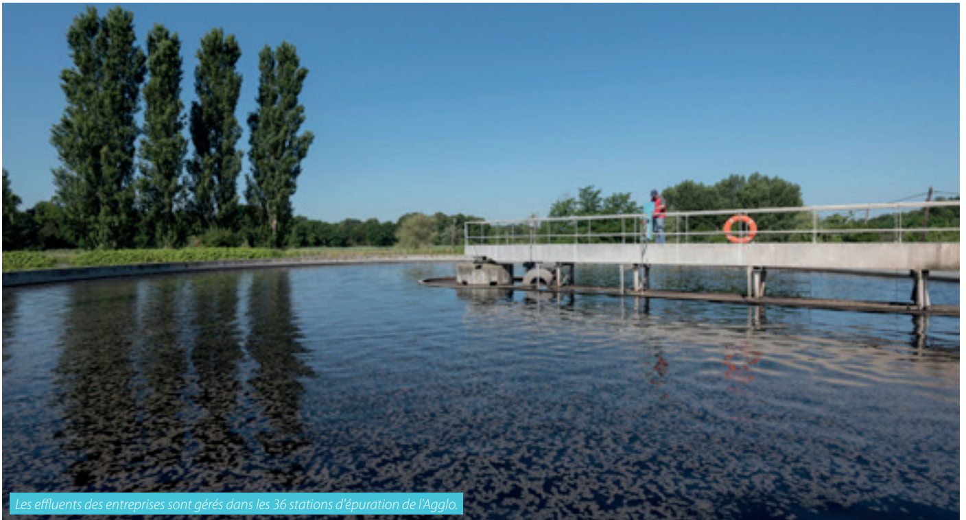
Les effluents des entreprises sont gérés dans les 36 stations d'épuration de l'Agglo.

L'Agglo lance officiellement le dispositif Qualité eau en direction des entreprises artisanales, commerciales et industrielles du territoire. Objectif : préserver la qualité des cours d'eau et nappes souterraines en accompagnant les entreprises dans la lutte contre les rejets polluants. Cette opération collective menée avec l'Agence de l'eau et les chambres consulaires est engagée jusqu'en 2019.