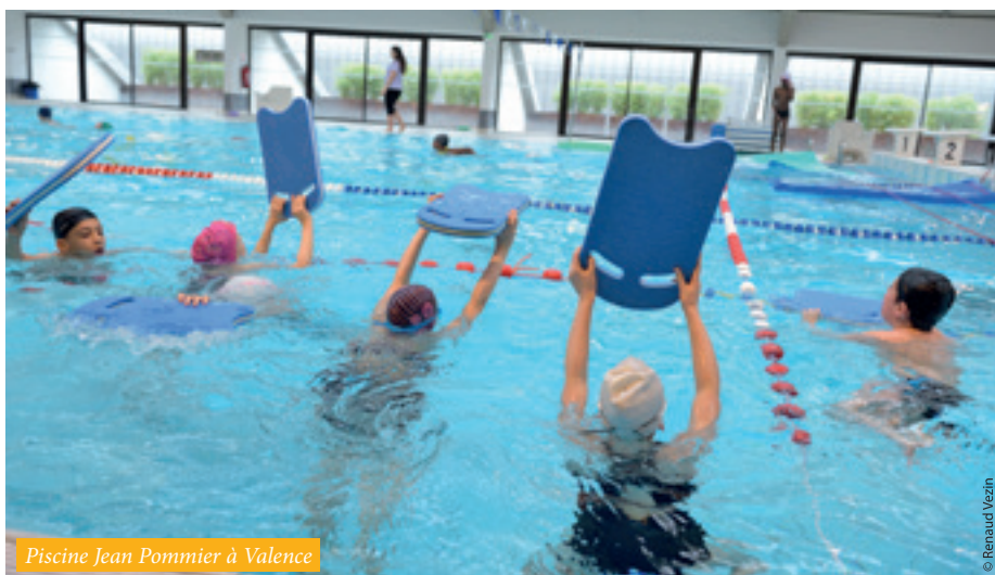
Piscine Jean Pommier à Valence