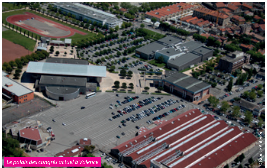
Le palais des congrès actuel à Valence

Prochaine étape phare du projet : le démarrage des travaux en 2018 pour une