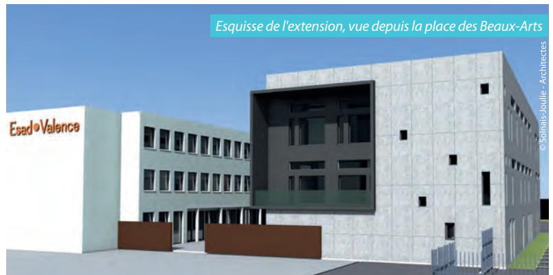
Esquisse de l'extension, vue depuis la place des Beaux-Arts

À ce jour, la Communauté d'agglomération a choisi l'équipe de maîtrise d'œuvre. Le chantier devrait démarrer à la fin du premier semestre 2016, pour accueillir les étudiants en septembre 2017.