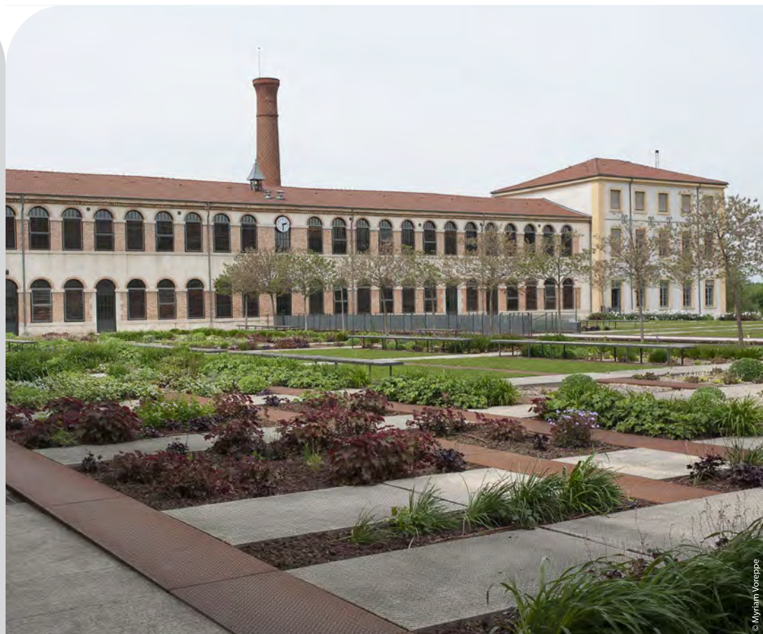
La Cartoucherie accueille 13 structures spécialisées dans l'animation et l'image : le studio de production Folimage, l'école européenne du cinéma d'animation La poudrière, l'association de promotion et de diffusion L'équipée, Les films du Nord, Dahu, Imag, SVD, la société de production Fargo, l'association des cinémas indépendants du sud de la région Rhône-Alpes Les Écrans, l'agence de communication Citron bien, Les contes modernes (structure de production audiovisuelle) et le studio indépendant Team To.

À noter par ailleurs, la sortie, dans quelques semaines, de Phantom boy , la nouvelle production des studios Folimage (dos du magazine).