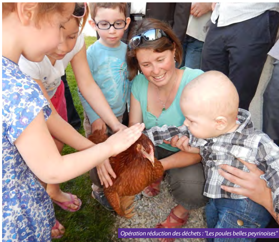
Opération réduction des déchets : "Les poules belles peyrinoises"

Tour de France, salon Tech'n bio, vide-greniers..., le pôle Prévention-sensibilisation du service Gestion des déchets accompagne de nombreuses manifestations du territoire en matière de prévention et de tri des déchets. Zoom sur l'ensemble de ses actions.