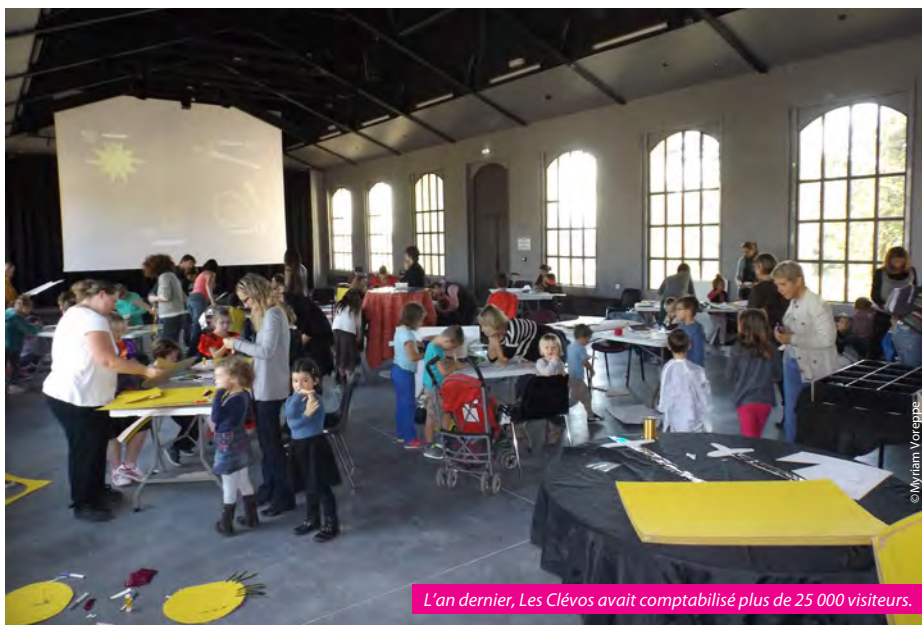
L'an dernier, Les Clévos avait comptabilisé plus de 25 000 visiteurs.

son cœur de métier : l'organisation d'expositions interactives en partenariat avec de grandes institutions culturelles et scientifiques 1 . Des expos désormais conçues pour le grand public (et non plus essentiellement pour les enfants) et accompagnées de médiations et d'ateliers d'expérimentation mis en place par l'équipe des Clévos.