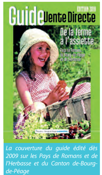
La couverture du guide édité dès 2009 sur les Pays de Romans et de l'Herbasse et du Canton de Bourg-de-Péage