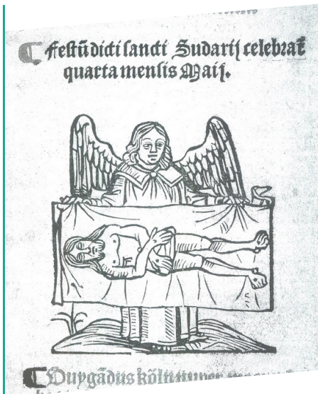
Le saint Suaire montré par un ange, in Office pour la vierge, Antoine Ranoto, 1531. Biblioteca Reale, Turin.