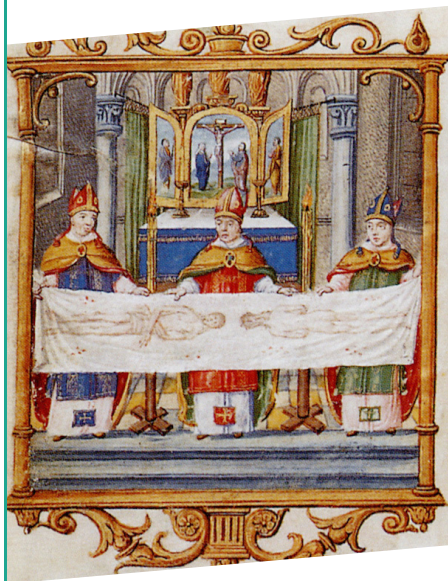
Ostension du Suaire de Chambéry, Livre d'heures de Christopher Dutch, suppléments peints en 1559, Turin, Biblioteca Reale, Varia 84, f. 3r.