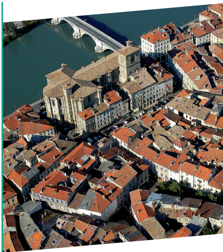
Vue de Romans

Départ Archives & Patrimoine - Site de Romans Conditions et réservation auprès de Pays d'Art et d'Histoire au 04 75 79 20 86 Durée : 2h