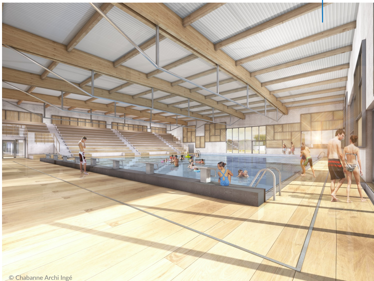
Un bassin ultra-performant avec fond mobile, inauguré en août 2019

Une extension de 2 700 m 2 avec un bassin supplémentaire