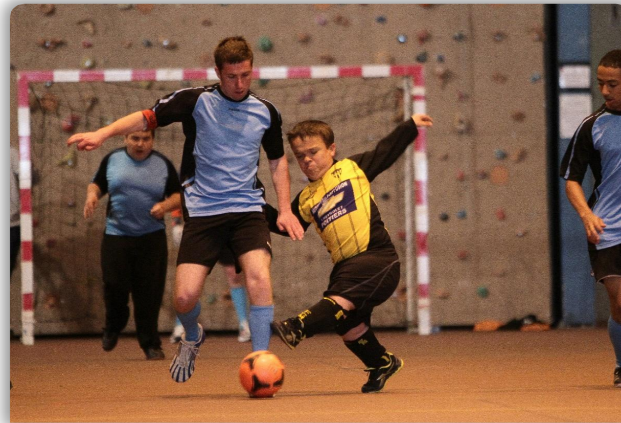
Foot à 5 en salle