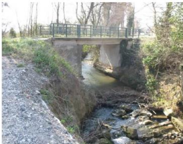
Vue du pont d'Ambonil depuis l'aval : fondations à nu et érosion prononcée des berges