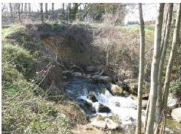
Seuil de calage du pont en amont du secteur médian : obstacle à la continuité écologique