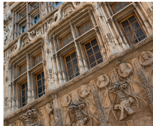
Maison des Têtes, Valence