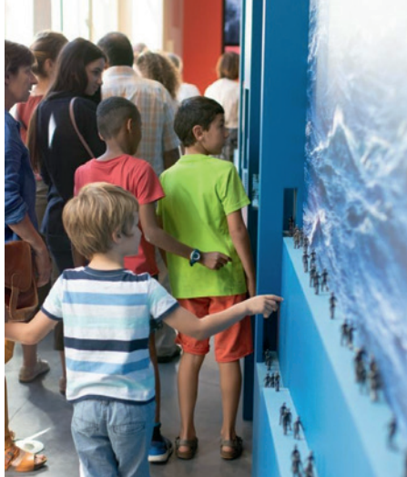
Visite « Nouvelles odysées »

Contact pour les actions éducatives : Laurence Vezirian