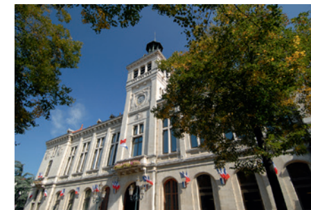
Hôtel de Ville, Valence