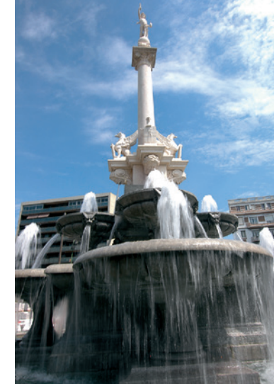
Fontaine monumentale sur les boulevards de Valence