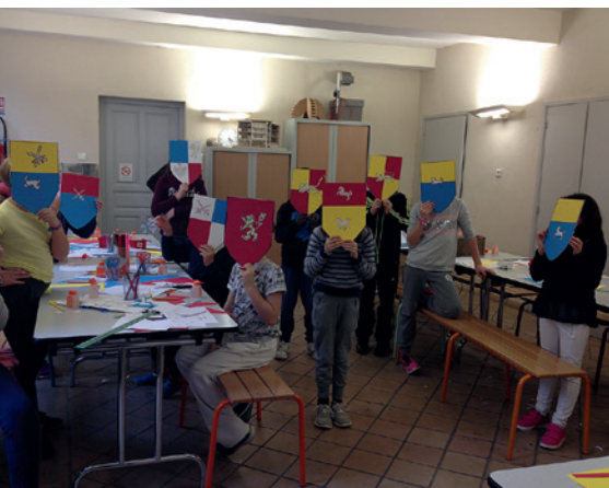
Atelier « blason »