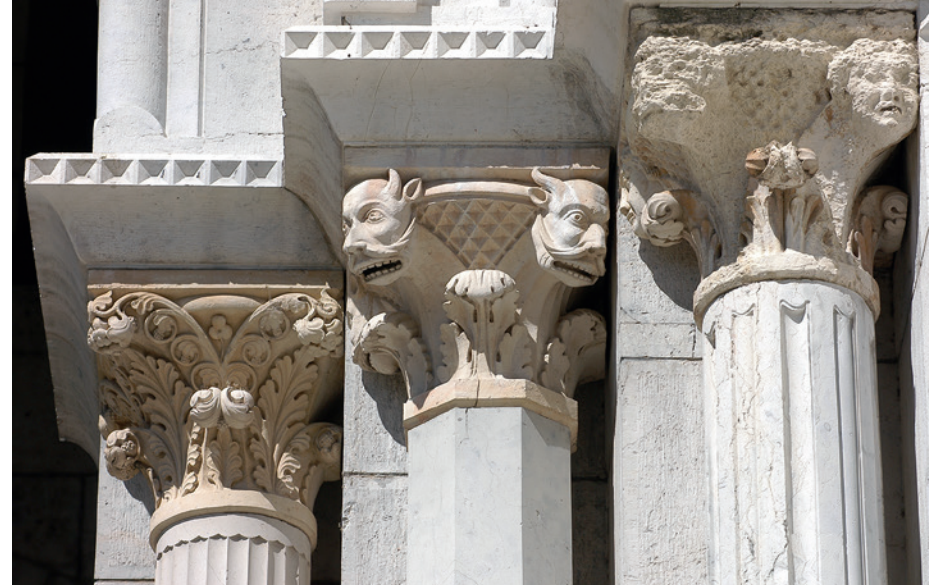
Monstres et chimères à la cathédrale Saint-Apollinaire

— CONNAÎTRE : s'initier à l'architecture et à son vocabulaire, connaître les formes géométriques.