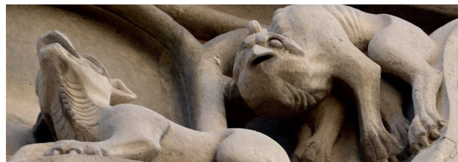
Monstres et chimères sur la façade de la Maison des Têtes