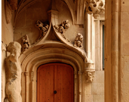
Bienvenue à la Maison des Têtes !