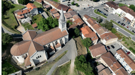
Église et centre ancien de Peyrins