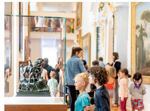
Visite dans le parcours permanent du musée

Contact pour les réservations : Pascale Chambon