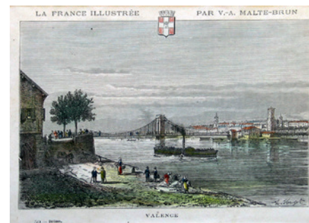
Valence vue depuis Granges au début du XIX e siècle. Estampe de Conrad Malte-Brun