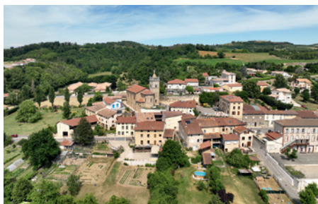
Bourg de Parnans