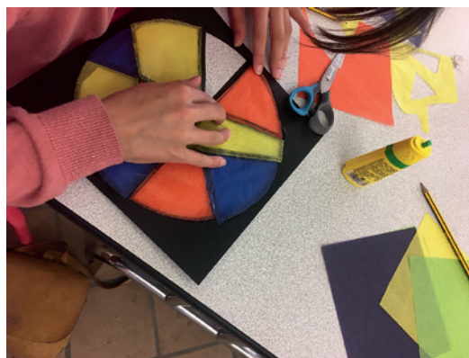
Atelier « vitrail »

— CONNAÎTRE : découvrir l'histoire, la fonction du blason et les règles qui régissent sa création.