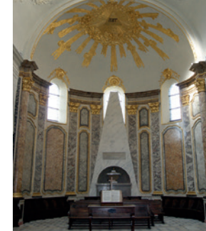
Cénotaphe révolutionnaire de Championnet, Valence