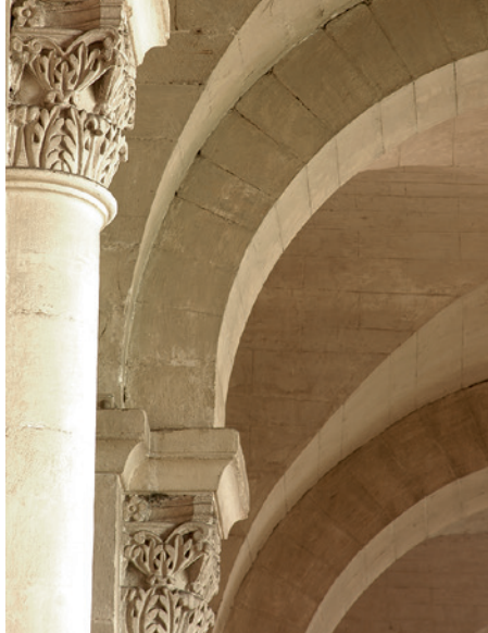
Cathédrale Saint-Apollinaire, Valence