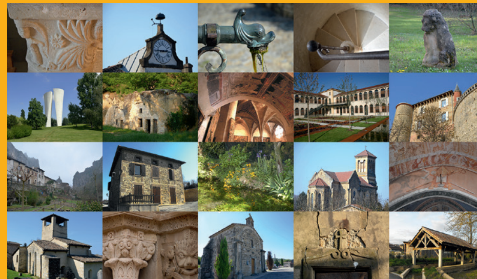
Monuments et patrimoine de Valence Romans Agglo

Châteaux et lavoirs, écoles de la III e République et églises romanes, places du village et paysages : le patrimoine est partout dans toutes les communes ! Le service Patrimoine - Pays d'Art et d'Histoire se déplace pour permettre à chaque enfant de bénéficier d'une visite de proximité, sur l'ensemble du territoire de l'Agglo (p. 18). Au départ de l'école ou de la mairie, les élèves sont invités à utiliser leurs sens (observation, audition, toucher) pour (re)découvrir leur environnement et leur histoire.