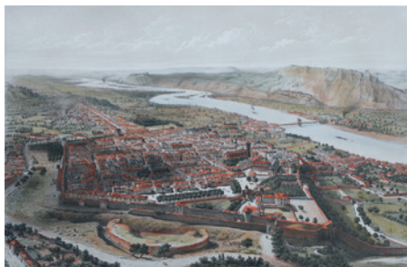
Vue de Valence, lithographie d'Alfred Guesdon, 1850

— CONNAÎTRE : découvrir la façon dont les grands bouleversements politiques, économiques et sociaux du XIX e siècle ont marqué l'architecture et l'urbanisme de la ville.