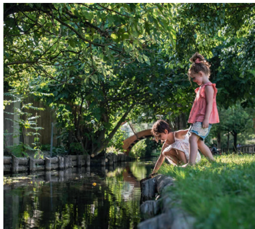
Les canaux de Valence