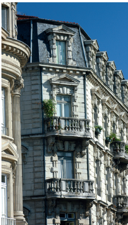
Immeuble haussmannien sur les boulevards de Valence

À noter pour l'année 2024-2025, une nouvelle visite à venir : « De la Première à la Seconde Guerre mondiale, les conflits du XX e siècle » (Valence et Romans).