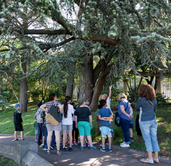
Visite au parc Jovet