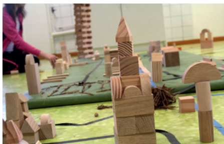
Des formes pour construire